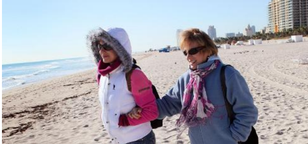
El calor se fue de Miami - FLORIDA

Los meteorólogos describieron la tormenta como una “ciclogénesis explosiva” que provocó un abrupto descenso de la presión atmosférica y se intensificó rápidamente en la costa atlántica. Se prevé que tras la tormenta se registrarán temperaturas gélidas, mientras el “vórtice polar” regresa a gran parte de Estados Unidos a finales de esta semana. El mes pasado, el presidente Trump citó las frías temperaturas invernales para reiterar su afirmación de que el calentamiento global es una farsa, pero climatólogos afirman que las emisiones de gases de efecto invernadero podrían estar contribuyendo a estos eventos